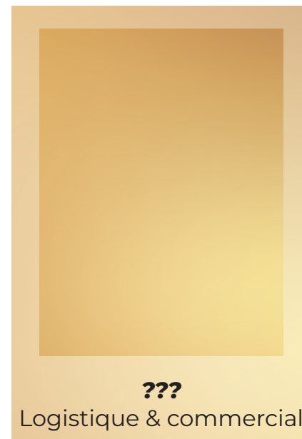
??? Logistique & commercial

+33 (0)6 72 21 74 03 pascal.sayous@centaure- production.fr