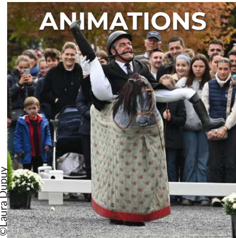
Animations pour petits et grands