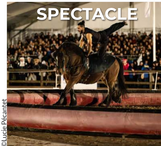
Spectacle équestre et soirée bodega (samedi)