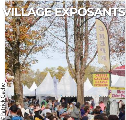
Village de 120 exposants Allée gourmande & food court